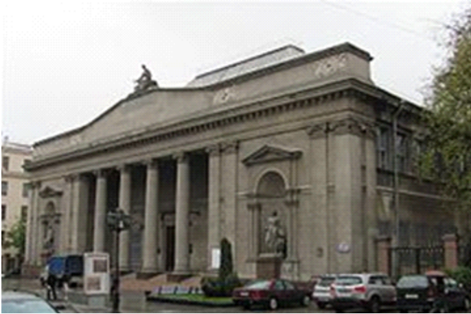
Het huidige Kunstmuseum in Minsk, Wit-Rusland

Het in het centrum gelegen Nationaal Kunstmuseum in Minsk herbergt de grootste collectie Wit-Russische en buitenlandse kunst van het land. De officiële geschiedenis van het museum begint in 1939. De collectie omvat meer dan dertigduizend kunstwerken die samen twintig verschillende collecties vormen. De twee belangrijkste verzamelingen bestaan uit nationale kunst en werken uit verschillende landen van de wereld.