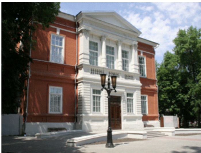
Het Staats Radishchev Museum in Saratov

Het Radishchev Museum in Saratov werd op 29 juni 1885 voor publiek geopend. Het was het eerste grote openbare kunstmuseum van Rusland. Het werd opgericht door Alexey Bogolyubov en vernoemd naar zijn grootvader, de 18e-eeuwse revolutionaire schrijver Alexander Radishchev.