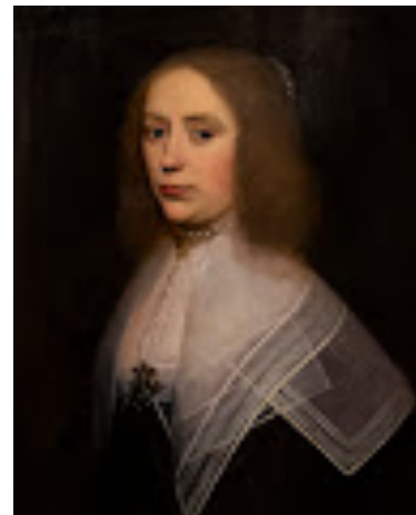
'Portret van onbekende vrouw', toegeschreven aan Michiel Jansz. van Mierevelt (1566-1641) Olieverf op hout, 68 x 54 cm Kunstmuseum Azerbeidzjan, Bakoe, Azerbeidzjan Invent. R-261/2683

In 2011 kreeg het museum het kwaliteitslabel van eerst nationaal en daarna European Museum Standard (EUMS) an de Raad van Beheer van de European Economic Chamber of Trade, Commerce and Industry, gevestigd in Brussel.