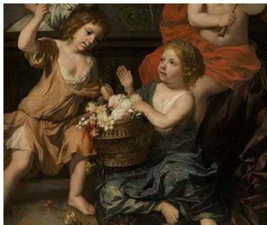
Detail: Gérard de Lairese, Allegorie op de jeugd met drie portretten van onbekende kinderen , olieverf op doek, 137,3 x 184 cm, inv.nr.90-3383, Havana, Museo Nacional de Habana

De Hermitage Amsterdam heeft de locatie voor een Vriendenbijeenkomst in 2022 ter beschikking gesteld.